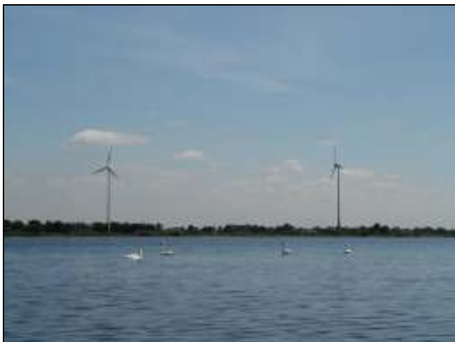
Baggersee Neuland – Blick nach Nord-Osten